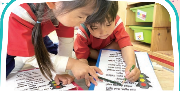
ランゲージタイム Language Time