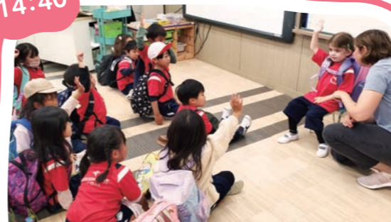
帰りの会 Afternoon Mtg.