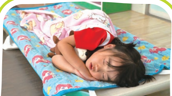
お昼寝(プリスクール) Nap Time (only for Preschool)