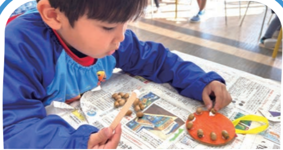
探究型アクティビティ Unit of Inquiry Time