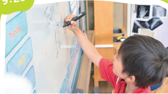
朝の会 Morning Mtg.