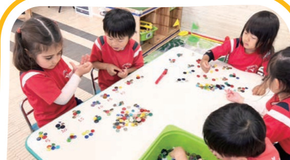
算数/体育 Math / PE