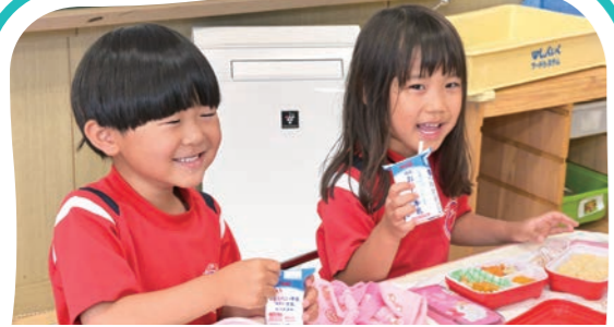
ランチ・休憩 Lunch and Recess Time