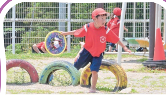
休憩・自由遊び Recess Time