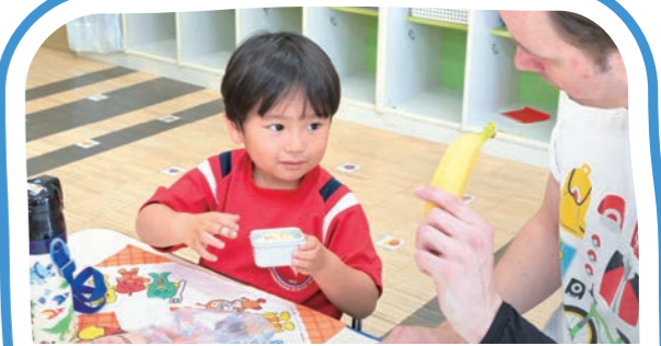
スナックタイム Snack Time