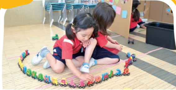
センタータイム Guided Centers