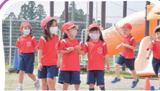
休憩・自由遊び Recess Time