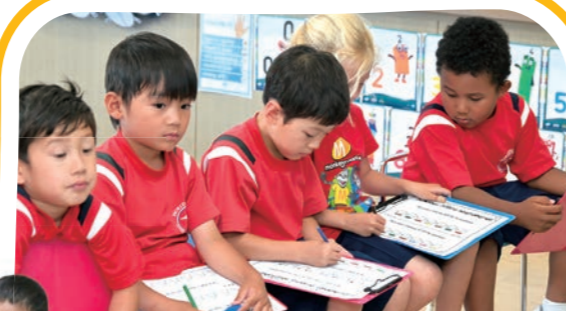
算数/体育 Math / PE