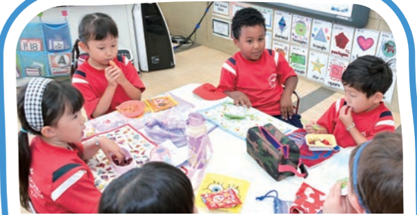
スナックタイム Snack Time