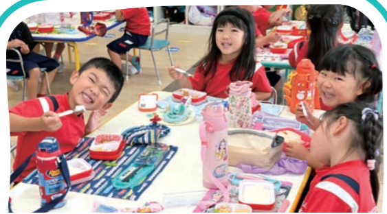
ランチ・休憩 Lunch and Recess Time