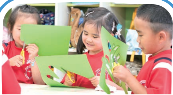
探究型アクティビティ Unit of Inquiry Time