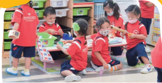
センタータイム Guided Centers