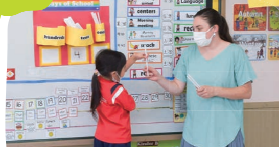
朝の会 Morning Mtg.