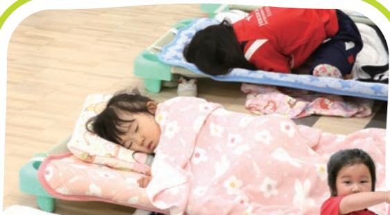
お昼寝(プリスクール) Nap Time (only for Preschool)