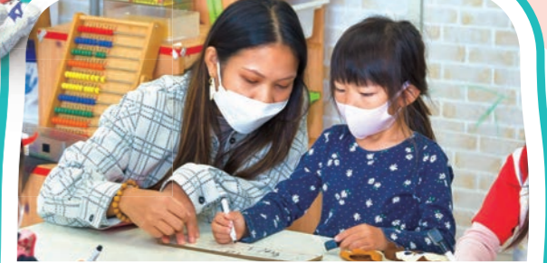
ランゲージタイム Language Time