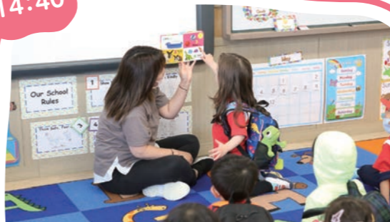
帰りの会 Afternoon Mtg.